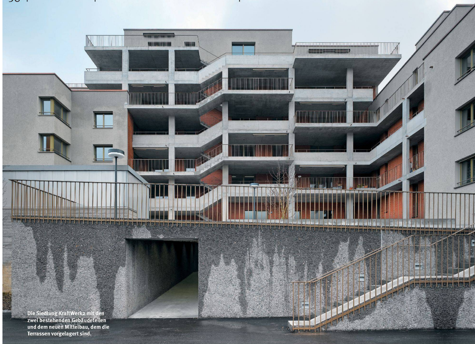
Die Siedlung KraftWerk2 mit den zwei bestehenden Gebäudeteilen und dem neuen Mittelbau, dem die Terrassen vorgelagert sind.