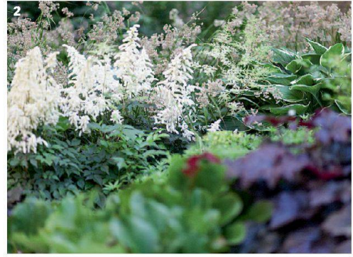
1/2 Die Beete im Randbereich bieten eine Vielfalt von Gräsern, Stauden und Sträuchern – Grüntöne harmonisieren mit dezenten Blütenfarben.