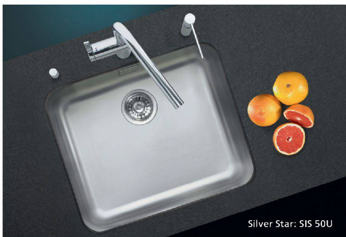
Silver Star: SIS 50U

ROBERT SPLEISS AG Bauunternehmung · Seestrasse 159 · CH-8700 Küsnacht · Telefon 044 385 85 85 · Telefax 044 385 85 07 · www.robort-spleiss.ch