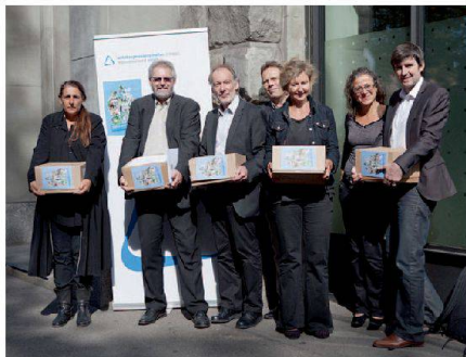
Das Initiativkomitee bei der Übergabe der Unterschriften

Vor rund fünf Monaten lancierte Wohnbaugenossenschaften Zürich eine Volksinitiative für mehr bezahlbaren Wohnraum im Kanton Zürich ( Wohnen hatte berichtet). Ende September konnte das Komitee die Initiative noch vor Ablauf der Sammelfrist einreichen. Mehr als 7000 Stimmberechtigte unterzeichneten sie, und Politiker verschiedener Parteien (SP, Grüne, AL, CVP), der Mieterinnen- und Mieterverband, kirchliche Kreise sowie Gewerkschaften unterstützten das Anliegen der Zürcher Wohnbaugenossenschaften. Sie verlangen, dass gemeinnützige Wohnbauträger beim Kauf von Land und Liegenschaften mit langfristigen zinsgünstigen Darlehen oder Abschreibungsbeiträgen aus einem neu zu schaffenden Fonds unterstützt werden. Zudem sollen Gemeinden die Rechtsgrundlage erhalten, eigene Wohnraumfonds einzurichten und so eine aktive Boden- und Wohnpolitik zu betreiben. Die Initiative fordert, das Wohnbauförderungsgesetz dahingehend zu ergänzen. (pd)