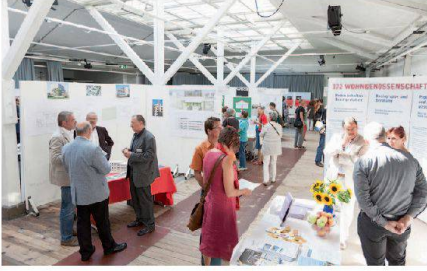
An einer Ausstellung konnten sich die Besucher über innovative Projekte informieren.