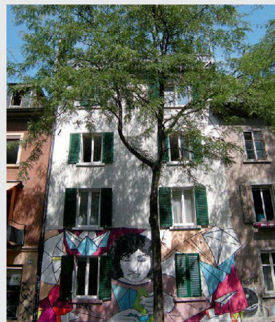
Künftig soll hier noch eine weitere Wohnung für selbstverwaltetes und kollektives Wohnen entstehen.

Die Bau- und Wohngenossenschaft «Durchbruch» in Zürich wurde 1995 gegründet, als sich den Gründerinnen und Gründern die Gelegenheit bot, in den Zürcher Kreisen 4 und 5 zwei Liegenschaften zu kaufen. Gemäss ihren Statuten bezweckt die Genossenschaft, ihren Mitgliedern preisgünstigen Wohnraum zu verschaffen und diesen dauernd der Spekulation zu entziehen, um selbstverwaltete, sichere und gemeinschaftliche Wohnformen zu verwirklichen. Das Gebäude wurde 1888 erstellt und hat gemäss dem Amt für Baubewilligungen denkmalpflegerisch und städtebaulich eine gewisse Bedeutung. Die Genossenschaftler leben in den sieben Wohnungen kollektiv zusammen. Beide Gebäude waren bereits beim Kauf sanierungsbedürftig und bieten wenig Komfort. Die Toiletten befinden sich im Treppenhaus und sind nicht direkt von den Wohnungen aus zugänglich; Duschen sind im Kellergeschoss eingebaut. Das Haus wurde früher von einer Baufirma für die Unterbringung von Saisoniers verwendet, wobei Duschkabinen und ein Waschtrog im Keller zu genügen hatten. Im Rahmen der nun anstehenden Renovationsarbeiten werden in einer der zwei