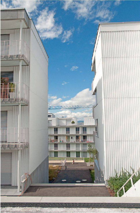
Die Wellernitfassade verleiht den Häusern eine gewisse Leichtigkeit.