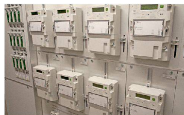
Messstation im Haus C.

Im Haus C der Siedlung Roost ist ein Pilotprojekt mit «Smart Metering» zwischen der Stadt Zug und den Wasserwerken Zug geplant. Messgeräte zeigen dem Mieter, wo er wieviel Strom braucht. Über das «Smart Grid» (intelligentes Stromnetz) kann der Elektrizitätskonsum gezielt gesteuert werden – stromfressende Geräte werden dann eingeschaltet, wenn viel Strom vorhanden ist, zum Beispiel über Mittag oder