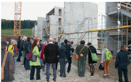
Im Oberfeld in Ostermundigen entsteht eine autofreie Siedlung mit hundert Wohnungen.

Dort entstehen nun drei ökologisch hochstehende Mehrfamilienhäuser, werden sie doch in Holzbauweise und im Standard Minergie-P errichtet. Zwar brauchen nur zehn Parkplätze erstellt zu werden, doch muss die Genossenschaft Vorkehrungen treffen, um nötigenfalls weitere Plätze zur Verfügung zu stellen. So ist etwa der Platz für eine Einstellhalle freizulassen. Um die Finanzierung zu erleichtern, vergibt man vierzig Prozent der Wohnungen im Eigentum. Allerdings wird auch dort der Genossenschafts-gedanke grossgeschrieben – dafür sorgen gemeinschaftliche Einrichtungen und Aussenräume, die in einem partizipativen Prozess gestaltet werden. Wohnen wird dieses Ausnahmeprojekt nach Fertigstellung ausführlich vorstellen. (rl)