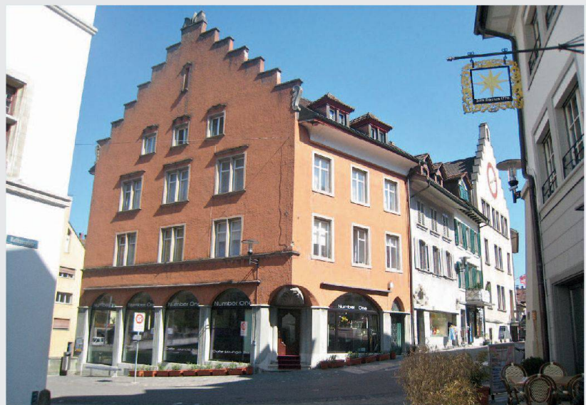
Erhaltenswert: die schicke Altstadt von Brugg

sogenannte Modellprojekte stellt. Diese unterstützt das Amt mit einem A-fondsperdu-Beitrag zusätzlich. Unabhängig von dieser Entscheidung hat der Stiftungsrat der Stiftung Solidaritätsfonds der Genossenschaft Altstadt Brugg für die anfallenden Erwerbs- und Renovationskosten ein rückzahlbares Darlehen in Höhe von 90 000 Franken gewährt.