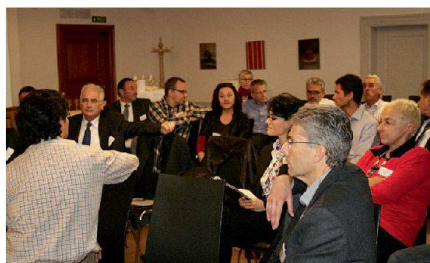
Hier können die Geschäftsführenden Erfahrungen austauschen. Diesmal ging es am Geschäftsführertreff um die Vergabep Praxis.

Beim 11. Herbsttreffen der hauptamtlichen Geschäftsführerinnen und Geschäftsführer stand die Frage zur Diskussion, ob Bauaufträge besser einzeln vergeben werden oder ob es sinnvoller ist, das gesamte Paket einem Generalunternehmer oder Totalunternehmer anzuvertrauen. Die Antwort vorweg: Es gibt nicht den richtigen oder falschen Weg, sondern immer nur projektspezifische Lösungen.