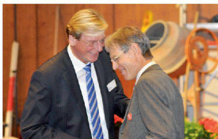
Der Verbandsratsvorsitzende des VDW bedankt sich für die Grussbotschaft aus der Schweiz.

Im Uno-Jahr der Genossenschaften pflegte Wohnbaugenossenschaften Schweiz auch den Kontakt mit Kollegen über die Lan-