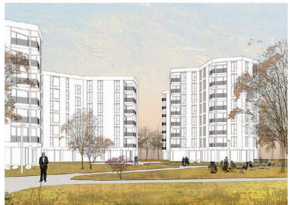
Das Siegerprojekt von Von Ballmoos Krucker Architekten sieht zwei halbrunde Bauten vor, die den Blick auf den Park freigeben.

SIEDLUNGSGENOSSENSCHAFT EIGENGRUND Die Siedlungsgenossenschaft Eigengrund (SGE) in Zürich will ihre Stammsiedlung Letzigraben durch Neubauten ersetzen. Die Häuser aus den 1940er-Jahren genügen den heutigen Anforderungen in Bezug auf die Bausubstanz und Raumstruktur nicht mehr. 68 der insgesamt 80 Wohnungen besitzen zwei oder drei Zimmer, wobei die 3-Zimmer-Wohnungen nur gerade 63 Quadratmeter aufweisen. Die Lage ist attraktiv, grenzt die Überbauung doch an die denkmalgeschützte städtische Grünanlage und Wohnsiedlung Heiligfeld.