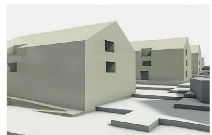
So werden sich die drei Neubauten mit den altersgerechten Wohnungen in Brügg bei Biel präsentieren.

Wohnungstyp ihr Portfolio sinnvoll ergänzen. Das 3100 Quadratmeter grosse Grundstück ist ihr von der Gemeinde zur Überbauung nach genossenschaftlichen Grundsätzen zur Verfügung gestellt worden. Es befindet sich mitten im Dorf. Die künftigen Bewohnerinnen und Bewohner werden neben preisgünstigen 2½- und 3½-Zimmer-Wohnungen über halbprivate Bereiche auf jeder Etage verfügen. Zudem werden die Neubauten Büroräume für die Gemeinde enthalten.