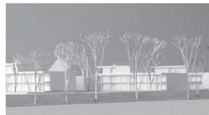
Moderner und kostengünstiger Familienwohnraum: Siegerprojekt von muellerueli.architekten.

Das Projekt sieht drei dreigeschossige Baukörper vor, die rund 20 3½- bis 5½-Zimmer-Wohnungen bieten. Zwi-