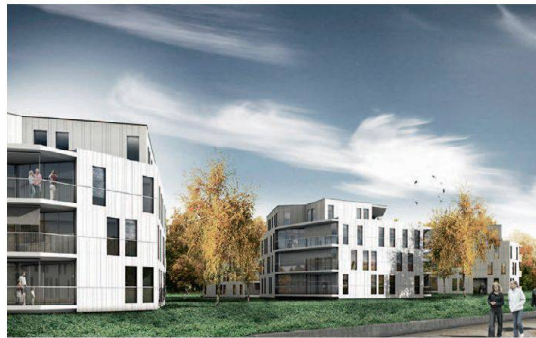
Acht Baukörper in einer Parklandschaft: das Siegerprojekt von Rapp Arcoplan für die Neubaussiedlung Kohlistieg in Riehen. Links das Alters- und Pflegeheim, das nach den Plänen von Bachelard Wagner erstellt wird.