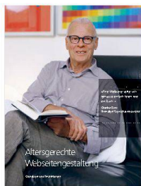
Cover der Publikation «Altersgerechte Webseitengestaltung».

BROSCHÜRE Im Zeitalter der Informationsgesellschaft nutzen auch immer mehr ältere und betagte Menschen internetbasierte Dienstleistungen oder informieren sich im weltweiten Netz. Wer die Bedürfnisse dieser Zielgruppe ernst nimmt, sollte deshalb seine Homepage «barrierefrei» gestalten. Das Institut für angewandte Informationstechnologie der Zürcher Hochschule für Angewandte Wissenschaften und das Zentrum für Gerontologie der Universität Zürich möchten alle Akteure – Webdesigner ebenso wie deren Auftraggeber – für dieses Thema sensibilisieren. Sie haben deshalb eine Broschüre herausgegeben, die konkrete Empfehlungen in Form von Prinzipien und Checklisten bietet (Bezug: www.age-web.ch ).