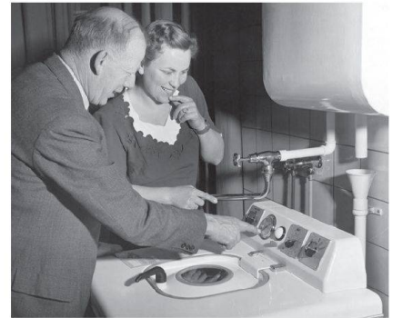
In der hundertjährigen V-Zug-Geschichte hat sich nicht nur das Waschen verändert.

100 JAHRE V-ZUG AG Seit 100 Jahren steht der Haushaltgerätehersteller V-Zug für Schweizer Qualität. Über vier Millionen Geräte stehen landesweit im Einsatz. Dabei ist die Geschichte von V-Zug eng mit der Geschichte der Waschmaschine in der Schweiz verknüpft. Zu Beginn der 1920er-Jahre stellte die damalige Verzinkelei Zug nämlich die erste, noch handbetriebene Wäschetrommel-Waschmaschine her, die die Hausarbeit stark erleichterte. Mit der Waschmaschine Unica war kurz darauf die klassische V-Zug-Waschküche – bestehend aus Waschmaschine, Waschherd, Zentrifuge und Spültrog – komplett.