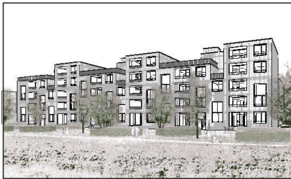
Neubausiedlung Neufeld von Lägerm Wohnen, entworfen von stoosarchitekten.

LÄGERN WOHNEN Dank einem Baurecht, das sie von der Römisch-Katholischen Kirche erhalten hat, kann die Baugenossenschaft Lägerm Wohnen eine Neubausiedlung mit 27 Wohnungen erstellen. Das Areal von gut 4000 Quadratmetern Grösse liegt an der Neufeldstrasse in Wettingen (AG). Nach dem Abschluss des Baurechtsvertrags im 2011 hat die Genossenschaft im vergangenen Jahr einen Studienauftrag unter fünf Architekturbüros durchgeführt. Die Jury entschied sich für den Vorschlag von stoosarchitekten aus Brugg. Entstehen sollen insbesondere Familienwohnungen.