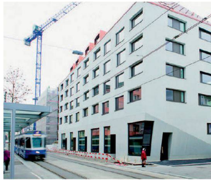
Modern und doch quartiergerecht – Siedlung Seefeldstrasse der SAW.

STIFTUNG ALTERSWOHNUNGEN DER STADT ZÜRICH (SAW) Im beliebten und teuren Seefeldquartier hat die SAW ihre jüngste Neubausiedlung eingeweiht. Der Bau an der Seefeldstrasse bietet 28 preisgünstige 2- bis 3 1/2-Zimmer-Alterswohnungen sowie vier Gewerberäume. Die Einbettung ins gewachsene Quartier, die speziellen Anforderungen der Quartiererhaltungszone sowie der schlammige Baugrund stellten grosse Herausforderungen an den