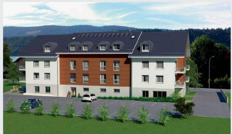
So wird sich die Alterssiedlung der Baugenossenschaft Primavesta in L'Abbaye am Lac de Joux präsentieren.

Kanton Waadt mittels eines Zuschusses von 10 Prozent der Miete während 15 Jahren subventioniert. Seitens der Gemeinde erhält Primavesta ein langfristig preisgünstiges Baurecht, bei dem die Gemeinde während 30 Jahren auf die Zahlung des Baurechtszinses verzichtet, wodurch die Mieten ebenfalls reduziert werden können. Die Stiftung Solidaritätsfonds unterstützt das sinnvolle Bauvorhaben mit einem rückzahlbaren Darlehen von 118 400 Franken. ks