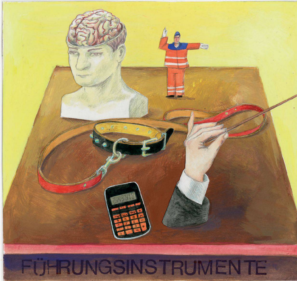
Illustration: Monika Zimmermann

Der Vorstand einer Baugenossenschaft muss eine Strategie haben und die Führungsinstrumente, um sie umzusetzen. Was dazu gehört, lernen Sie in unserem Managementlehrgang (Kurs Nr. 13–23).