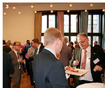
3 Beim Apéro riche blieb Zeit fürs Vernetzen.