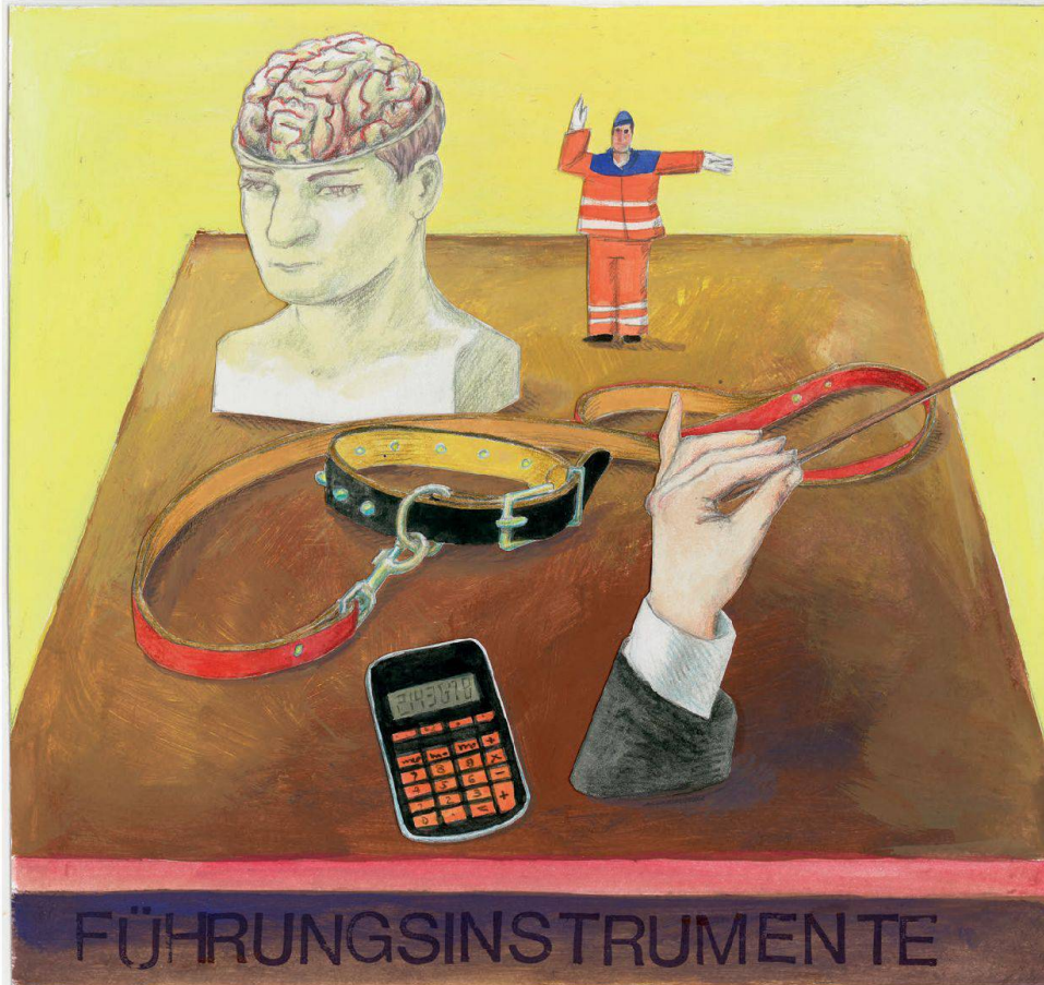
Illustration: Monika Zimmermann

Der Vorstand einer Baugenossenschaft muss eine Strategie haben und die Führungsinstrumente, um sie umzusetzen. Was dazu gehört, lernen Sie in unserem Managementlehrgang (Kurs Nr. 13–23).