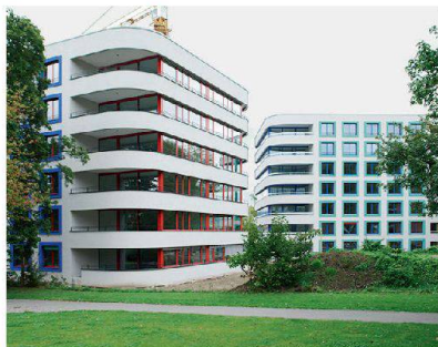
Anerkennungspreis: Ersatzneubauten Else-Züblin-Strasse der Siedlungsgenossenschaft Sunnige Hof.

SUNNIGE HOF 123 Eingaben hat eine Fachjury für die Auszeichnung guter Bauten im Kanton Zürich erhalten. Zwar schaffte es kein Wohngebäude auf die drei Podestplätze. Einen der drei Anerkennungspreise gewann jedoch die Ersatzneubausiedlung der Siedlungsgenossenschaft Sunnige Hof in Zürich Albisrieden. Die sechs Häuser mit insgesamt 149 Wohnungen, entworfen vom Architekturbüro Burkhalter Sumi, bestechen insbesondere durch ihr Farbkonzept.