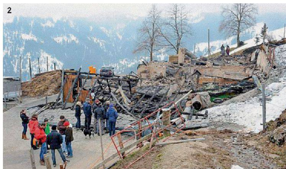
1 Im Oktober 2013 konnte die Aufrichte gefeiert werden.