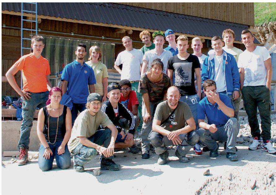
Gruppenfoto nach getaner Arbeit: Lernende von ABZ, BGZ, FGZ und GGZ.

Mit anpacken, um die Notlage einer Bauernfamilie zu lindern: Diese Erfahrung machten 18 Lernende im fünften «Pack's!»-Lehrlingslager.