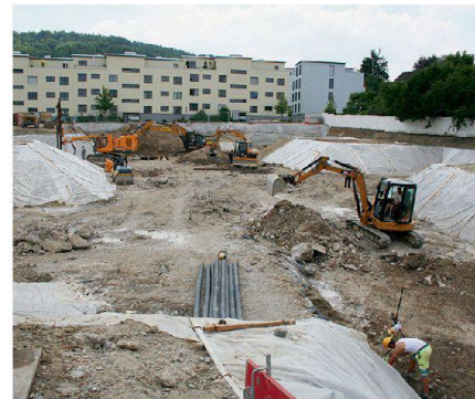
Am Bauboom im Bereich Mehrfamilienhaus sind auch die Baugenossenschaften beteiligt: Baustelle der Bahoge in Zürich Schwamendingen.

gen oft nicht den Bedürfnissen des Marktes. Ein grosses Problem bestehe zudem darin, die richtigen Haushalte in die richtigen Wohnungen zu bringen.