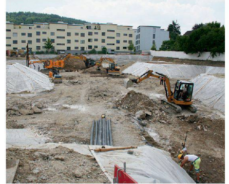
Am Bauboom im Bereich Mehrfamilienhaus sind auch die Baugenossenschaften beteiligt: Baustelle der Bahoge in Zürich Schwamendingen.

gen oft nicht den Bedürfnissen des Marktes. Ein grosses Problem bestehe zudem darin, die richtigen Haushalte in die richtigen Wohnungen zu bringen.