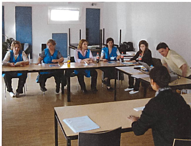
Unsere Treppenhaus-ReinigerInnen werden geschult von der GAREBA GmbH, 6340 Baar