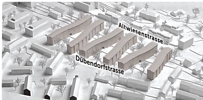
Projekt von BS + EMI für das Baufeld A im Schwamendinger Dreieck. Die Neubauten werden 210 Wohnungen bieten.