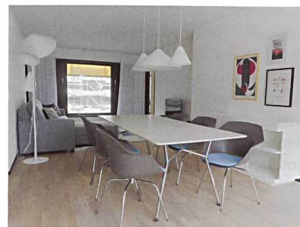
Blick in die Gästewohnung der BGZ in der Neubausiedlung Wriighthouse im Glattpark. Sie steht allen Mitgliedern des Gästewohnungsring zur Verfügung.

Im Gegenzug können die BGZ-Genossenschafterinnen und -Genossenschafter ab sofort aus mehreren Dutzend Wohnungen in 18 deutschen Städten sowie in Luzern auswählen und diese zu günstigen Konditionen mieten. Im Angebot sind möblierte Wohnungen mit Kochgelegenheit in so attraktiven Destinationen wie Berlin, Hamburg, Düsseldorf, Dresden, Leipzig oder auf Rügen. Selbstverständlich können BGZ-Mieterinnen und -Mieter auch die BGZ-Wohnung im Glattpark mieten, falls sie Freunde, Verwandte oder Bekannte zu Besuch erwarten.