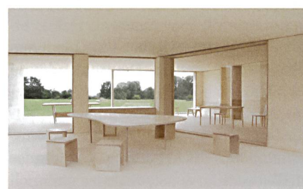
So könnte sich die gemeinschaftlich genutzte Lobby präsentieren.

haltige Konzept mit dem geringen Flächenverbrauch ermöglicht vergleichsweise kostengünstige Mieten. Das Siegerprojekt ist als reiner Holzbau konzipiert und soll bis Herbst 2017 bezugsbereit sein. Es wird Wohnraum für rund hundert Menschen bieten.