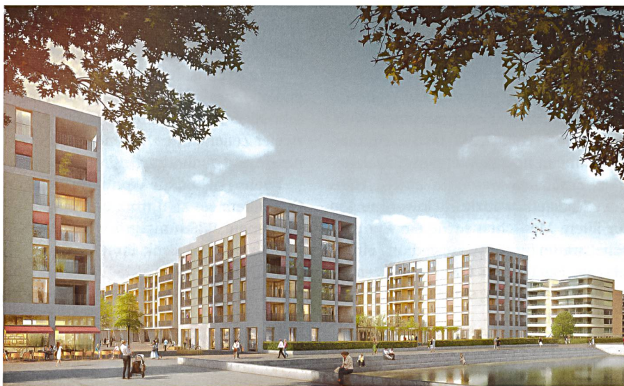
280 Wohnungen erstellt die ABZ im Glattpark nach Plänen von Pool Architekten. Im Modell ist das Projekt braun markiert.

ABZ Die Allgemeine Baugenossenschaft Zürich (ABZ) hat den Architekturwettbewerb für die Neubausiedlung im Glattpark abgeschlossen. Das Projekt von Pool Architekten (Zürich) und Studio Vulkan Landschaftsarchitektur (Zürich) ging als Sieger hervor. Dafür hat die ABZ im neuen Stadtteil in Opfikon, direkt an der Zürcher Stadtgrenze, von der Stadt Zürich rund 24 000 Quadratmeter Land erworben. Die Genossenschaft will mit ihrer Siedlung nicht nur einen markanten Schlusspunkt im neuen Quartier setzen, sondern auch das Quartierleben im Glattpark und in Leutschenbach aktiv mitgestalten.