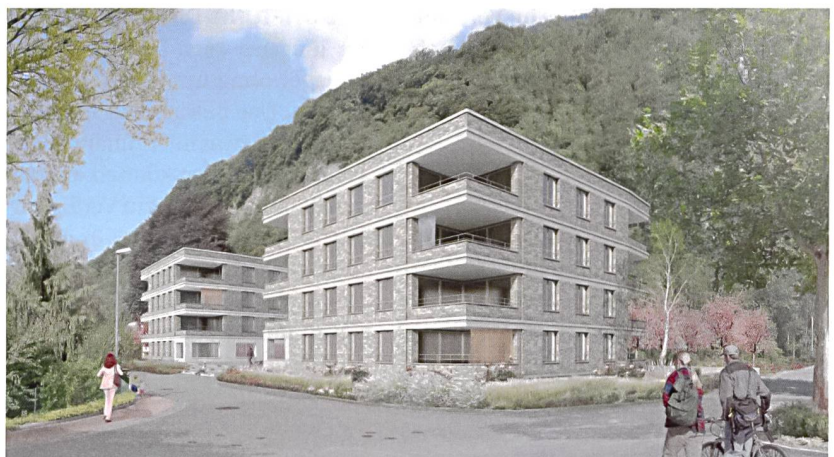
Projekt von BBK Architekten für die Wohnsiedlung am Birkenweg in Vaduz.

bitiösen Minergie-A-Standard. Auch in Bezug auf die Ortsentwicklung sei der Neubau beispielhaft. All dies seien Aspekte, die eine entscheidende Rolle für das Liechtenstein von morgen spielten. 2016 sollen die 22 familienfreundlichen Wohnungen fertig sein.