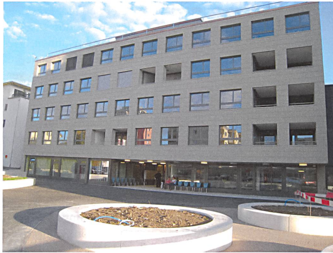
Der Neubau Bahnhofstrasse 256 befindet sich beim Postplatz Kempten. Vor dem Haus entsteht ein öffentlicher Platz.

Der Neubau liegt an der Bahnhofstrasse 256 und grenzt an zwei bestehende Siedlungen der Genossenschaft. Die Wohnungen sind über einen Lichthof erschlossen. Die 17 2½- und 14 3½-Zimmer-Wohnungen bestechen durch hohen Komfort und zeitgemässe Flächen. Im Parterre soll ein «Quartierzimmer» eingerichtet werden, ein Gemeinschaftsraum, der einem breiteren Publikum offensteht.