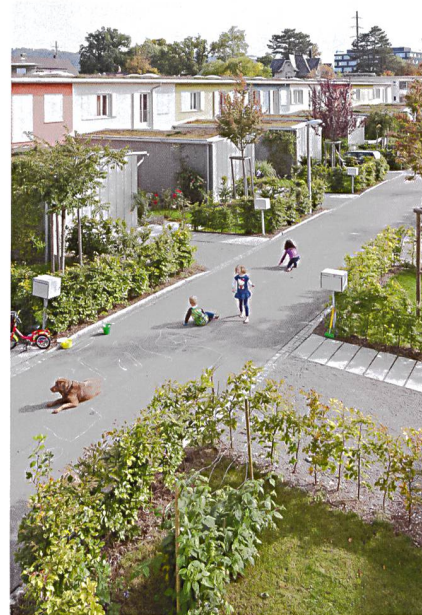
Der grosse HGW-Wohnungs-bestand erfordert laufend Sanie-rungen, so etwa bei den ab 2008 erweiterten Kreuzreihen-häusern im Stadtrain- oder «Birchermüesliquartier».

Genossenschaften haben seit einiger Zeit einen immer grösseren Stellenwert, man nimmt sie vermehrt wahr. Ihr Image hat sich in der Öffent-lichkeit und bei Politikern positiv verändert. Durch Aufklärung und Information, gute Bei-spiele und auch dadurch, dass Leute in den Vorständen sind, die ein wirtschaftliches Ver-ständnis haben. Es braucht nämlich beides, wirtschaftliches und gemeinschaftlich-soziales Denken, sonst geht es nicht. Ich bin optimis-tisch, dass sich das weiter positiv entwickelt. ■