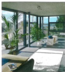
Titelbild: Viel zusätzlichen Wohnraum hat die Wohnbaugenossenschaft Meisenweg in Burgdorf mit Glasanbauten geschaffen.

Richard Liechti, Chefredaktor wohnen@wbg-schweiz.ch