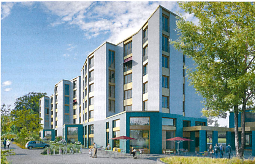
So wird sich das dreiteilige Wohnhaus gemäss dem Entwurf von Neff Neumann präsentieren. Im Vordergrund der mit der Schule gemeinsam genutzte Zwischentrakt.

ten die beiden Bauträgerinnen die Wohnbaubüro AG mit der Durchführung eines Architekturwettbewerbs. Nach einem Selektionsverfahren unter vierzig Bewerbern reichten schliesslich sieben Büros Vorschläge ein. Das Preisgericht entschied sich für das Projekt von Neff Neumann Architekten AG, Zürich. Sie entwarfen einen sechsgeschossigen Wohntrakt entlang der Rehbühlstrasse, der gemäss Jury im Zusammenspiel mit der zweigeschossigen Erweiterung des Schulhauses sehr gut gewählt ist. Die Lücke zwischen Wohntrakt und Schulhaus bildet ein gut proportionierter Platz, der einen überdachten Durchgang zum Parkraum offenlässt. Direkt am Platz befindet sich auch das gemeinsame Bistro. Um stets genügend Alterswohnungen anbieten zu können, wird die Realisierung in zwei Etappen erfolgen.