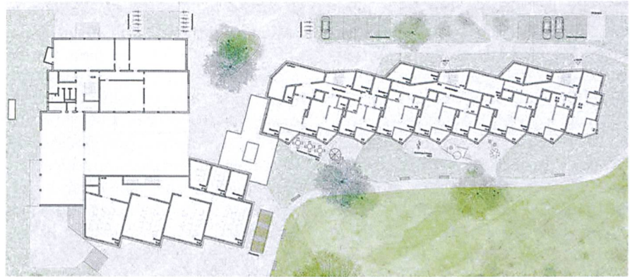
Situationsplan. Von links: Bestehendes Schulgebäude, Schulerweiterung, gemeinsamer Zwischentrakt mit Bistro, Alterswohntrakt.

Entstehen werden rund 46 Wohnungen. Darunter sind auch drei Wohnungscluster, bei denen sich jeweils vier oder sechs Einheiten einen Gemeinschaftsraum teilen werden. Das Areal grenzt südlich an einen grossen Grünraum, dessen Qualität es zu erhalten galt. Um die vielfältigen Ziele zu erreichen, beauftrag-