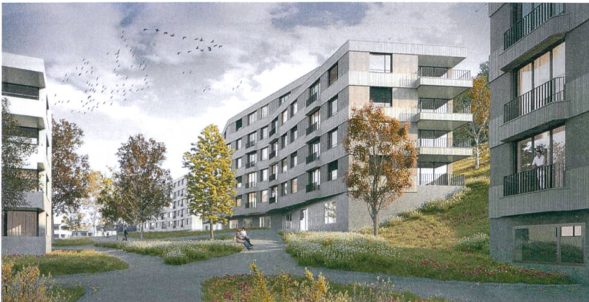
Die Neubauten werden einen grossen Siedlungsplatz bilden.

ALLGEMEINE BAUGENOSSENSCHAFT LUZERN (ABL) Die ABL erneuert ihre Siedlung Obermaihof 1, die heute 137 Wohnungen aus den späten 1940er-Jahren umfasst. Mit einer Siedlungsgliederung – Sanierungen, Erweiterungen, Neubauten – strebt die Genossenschaft einen ausgewogenen Mix von nach wie vor günstigem Wohnraum und Neubauwohnungen an. Diese komplexe Aufgabe schrieb die ABL in einem Projektwettbewerb unter acht Architekturbüros aus.