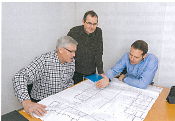
Für ihren Strategieprozess nutzt die SILU (oben: Baukommission, rechts: Finanzkommission) die BSC als Managementinformations- und Führungsinstrument.

Wirklich gewinnbringend ist seiner Meinung nach die BSC für eine Baugenossenschaft dann, wenn sie sie konsequent als Managementins-