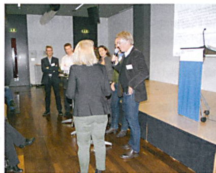
Lebhafte Abschlussdiskussion an der Fachtagung «Schlau erneuern».