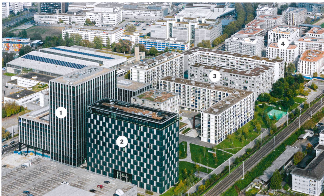
«Neubaumeile» in Zürich Leutschenbach: