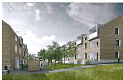
Wohnen in der zweiten Lebenshälfte: Visualisierung des Projekts Muttimatte.

BIWOG Trotz Wintereinbruch schritt der Vorstand der Bieler Wohnbaugenossenschaft Biwog gemeinsam mit Vertretern des Planungsbüros, der Gemeinde sowie interessierten Mietern zum Spatenstich für ihr Neubauprojekt in Brügg. Nach langer Planungsphase kann das 13-Millionen-Projekt in den nächsten Monaten in die Tat umgesetzt werden. Im Auftrag der Gemeinde Brügg erstellt und betreibt die Biwog im Dorfkern eine Siedlung für das Wohnen in der zweiten Lebenshälfte. Die künftigen Mieterinnen und Mieter werden in einer Hausgemeinschaft leben, in der das nachbarschaftliche Zusammenleben bewusst gefördert wird.