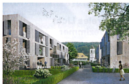
Das Projekt Kochermatte, ein Holz-Beton-Bau, entworfen von :mlzd Architekten.

KOCHERMATTE In Aegerten (BE) soll eine altersgerechte Wohnsiedlung entstehen, die auf Selbsthilfe und nachbarschaftlicher Unterstützung gründet. Der Entwurf des Bieler Büros :mlzd sieht vier dreigeschossige Längsbauten vor, die einen Zentrumsplatz offenlassen und insgesamt 32 Wohnungen bieten. Zum Raumprogramm gehört ein beträchtlicher Gemeinschaftsteil, der neben Cafeteria und Bibliothek auch einen Wellnessbereich und eine Werkstatt umfassen soll. Die Siedlung soll von einer Wohnbaugenossenschaft betrieben werden, für die derzeit Mitglieder gesucht werden; Kontakt unter www.kochermatte.ch .