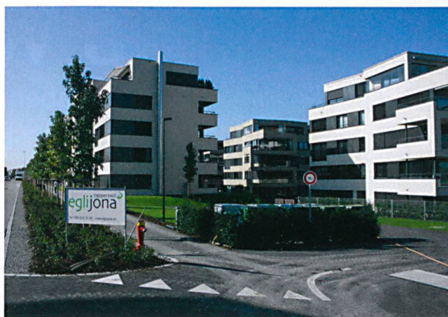
Bei der Überbauung «Luferwis» in Altendorf wurden 2300 Quadratmeter Klimaplaten verklebt.