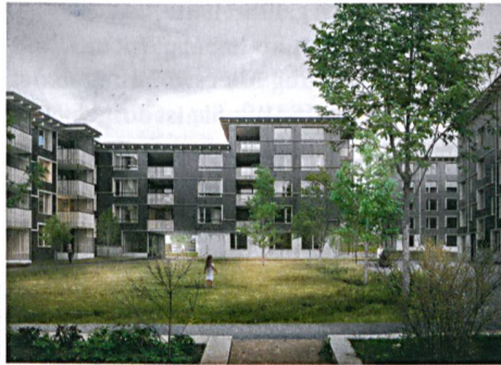
227 Neubauwohnungen wird die Siedlung Klosterbrühl dereinst bieten.

Rund 230 Wohnungen sollen anstelle der 127 veralteten Einheiten entstehen, die heute vorwiegend Einpersonenhaushalte beherbergen. Zielpublikum der Neubauten sind neben Familien auch Ein- und Mehrpersonenhaushalte ohne Kinder, die diese Wohnungen generationenübergreifend bis ins hohe Alter nutzen. Der Grossteil wird dreieinhalb und viereinhalb Zimmer umfassen, wobei es innerhalb dieser beiden Grössen je eine Kategorie «kompakt» (90 bis 95 Quadratmeter Fläche bei der 4½-Zimmer-Woh-