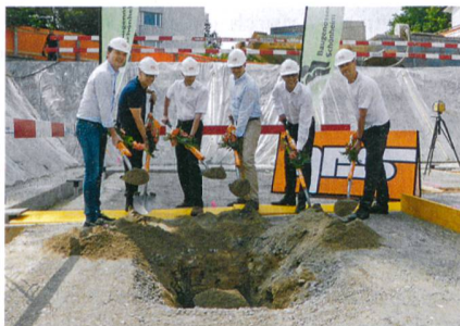
Am 11. Juni setzten Baugenossenschaft, Architekt und GU zum Spatenstich für den Neubauteil der Siedlung Eyhof an.

Entworfen hat die drei vier- bis sechsgeschossigen Holzbauten, die auf einem Sockelgeschoss aus Beton ruhen, die Adrian Streich Architekten AG aus Zürich. Um die hohe Wohnqualität trotz Verdichtung zu erhalten, sind grosszügige Grünräume und ein Quartierplatz vorgesehen. Die Baugenossenschaft Schönheim realisiert das 40-Millionen-Projekt zusammen mit der Generalunternehmung HRS Real Estate. Der Bezug ist für Anfang 2017 vorgesehen.