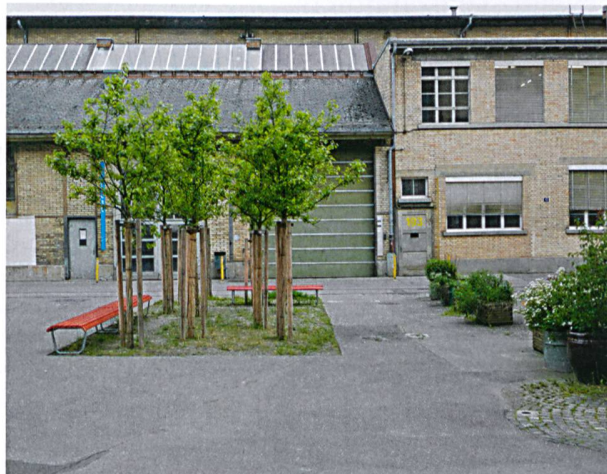
Bäume und Sitzgelegenheiten sorgen für weitere Auflockerung und Begegnungsmöglichkeiten.