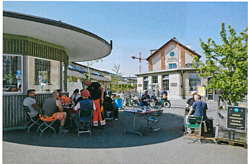
Zentrale Anlaufstelle des Lagerplatzes ist das Bistro «Portier», es ist Quartiertreffpunkt und Informationsdrehscheibe zugleich.

Ein überdachter Platz – eine ehemalige Kranbahn – wird vom Arealverein für regelmäßige Anlässe wie beispielsweise Nachtbazare genutzt.