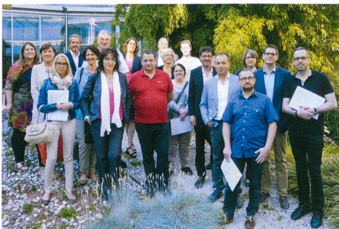
Erfolgreiche Absolventen des ersten Management-Lehrgangs in der Romandie.