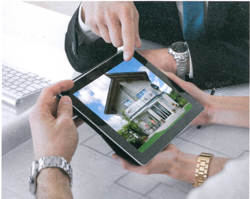
Ganzheitliche, objektspezifische Beratung bringt die massgeschneiderte Lösung.

In vielen Fällen (gerade im Sanierungsmarkt) sind hoch qualifizierte Energiespezialisten der Ansicht, dass die Ölheizung ökologischer sein kann als eine Wärmepumpe. Ihre Überzeugung: Wer sich blind für einen alternativen Energieträger entscheidet, kann in bestimmten Fällen der Umwelt sogar mehr Schaden zufügen. Es sei daher ein grosser Fehler, Wärmepumpen in einem Gebäude zu installieren, das dafür nicht geeignet ist. Wenn zum Beispiel die Vorlauftemperatur – das heisst die Temperatur des Wassers, das zu den Heizkörpern fliesst – hoch ist, führt das Ersetzen der Ölheizung durch eine Wärmepumpe zu einem deutlich überhöhten Stromverbrauch. In einem solchen Fall, vor allem bei Renovationen, sind die Luft-Wasser-Wärmepumpen ineffizient und daher meist ungeeignet. Ausserdem ist mit einer solchen Massnahme das Geld falsch investiert: Wer seine alte durch eine neue, energieeffiziente Ölheizung zum Preis von 15000 bis 20000 Franken ersetzt, spart gegenüber