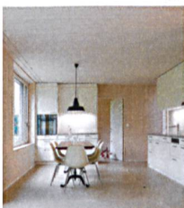
Titelbild: Bei der Neubausiedlung Huebacher der Baugenossenschaft Rotach bestimmt Holz auch das Wohngefühl.

Richard Liechti, Chefredaktor wohnen@wbg-schweiz.ch