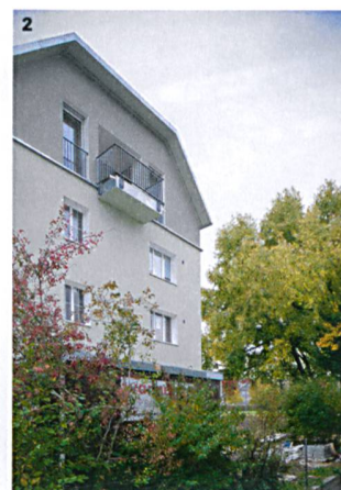
Bilder: Martin Bichsel