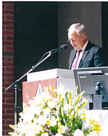
Die diesjährigen Grenchner Wohntage trafen auf den Nationalen Zukunftstag. Aus diesem Anlass durften Grenchner Schulklassen ihre Wohnwünsche darstellen. Oben: Bundesrat Johann Schneider-Ammann beim Eröffnungsreferat.