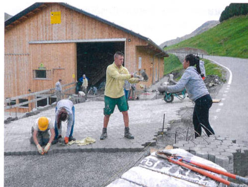
Anpacken und helfen – Schnappschüsse aus dem Lehrlingslager 2015 in Cresta (GR).