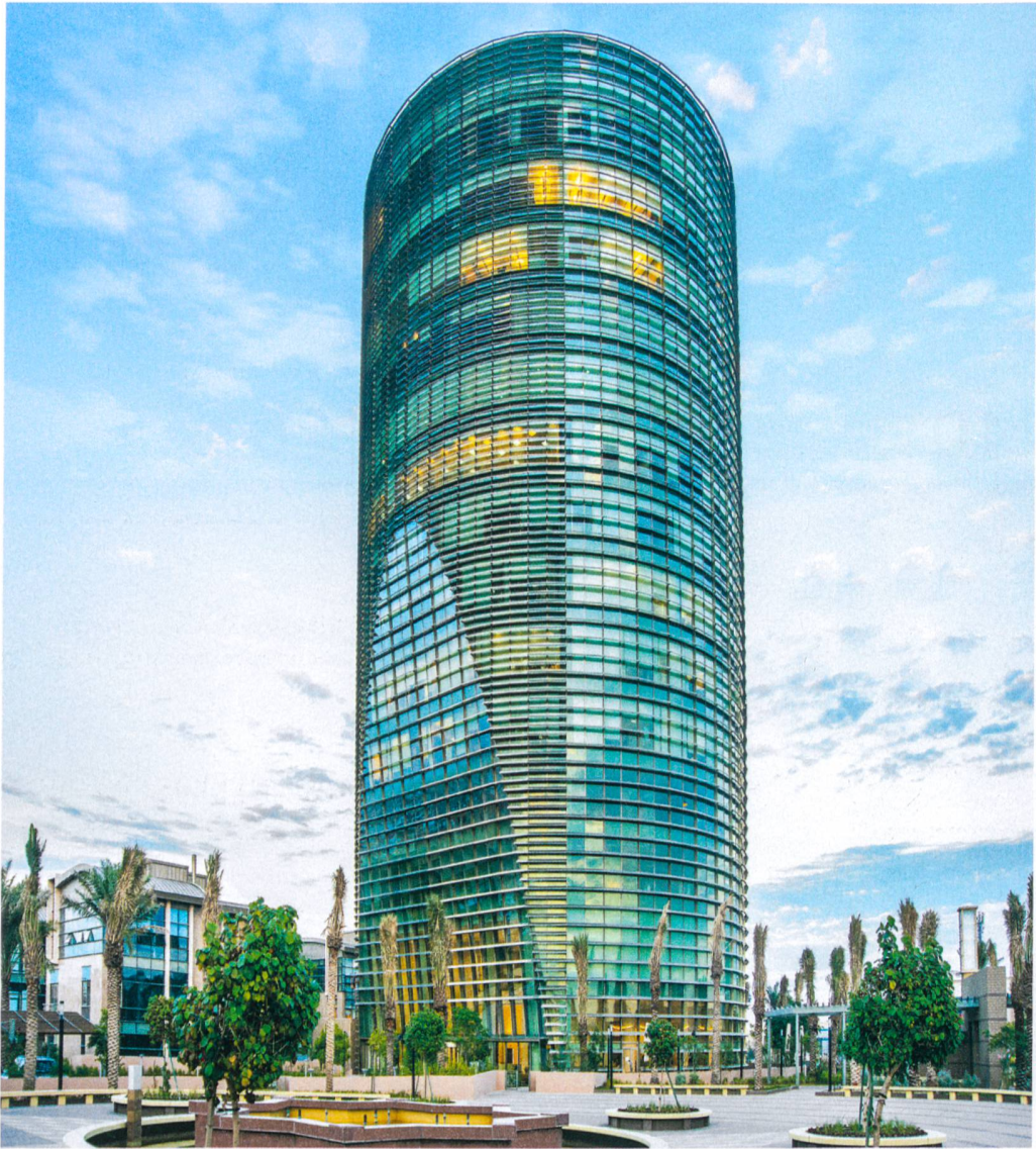
Alturki Business Park Al-Kohbar, Saudi Arabia