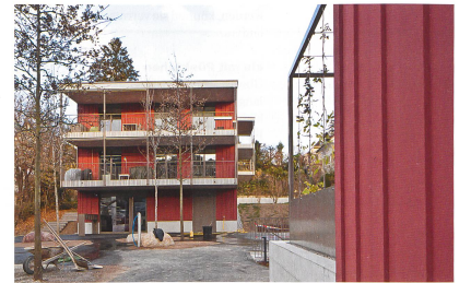
WOHNEN 12 JANUAR/FEBRUAR 2015

▼ Ein Punktbau ergänzt den an der Strasse gelegenen Langbau.