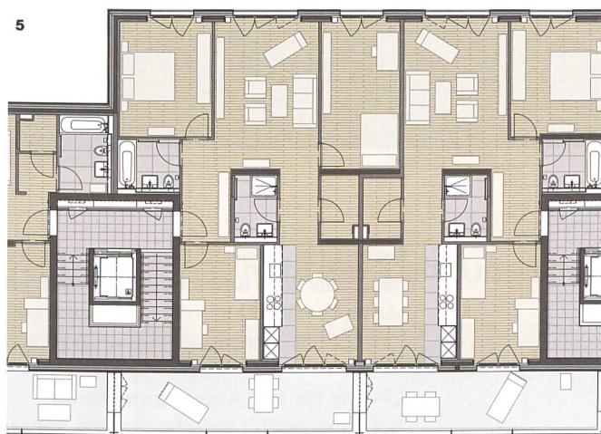
4 Ein in der Tiefe gestaffelter Längsbau und ein Punktbau bilden die neue Siedlung.