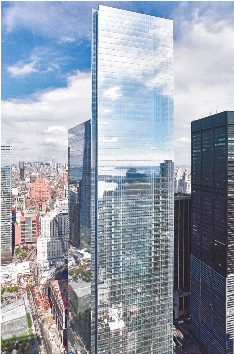
4 World Trade Center, New York