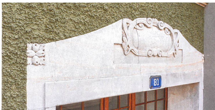
Die Sandsteingewände blieben erhalten. Sie konnten um zwei Zentimeter aufgedoppelt werden.