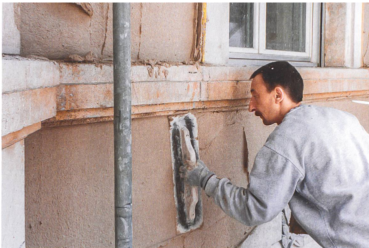
Aufbringen des Aerogel-Putzes.