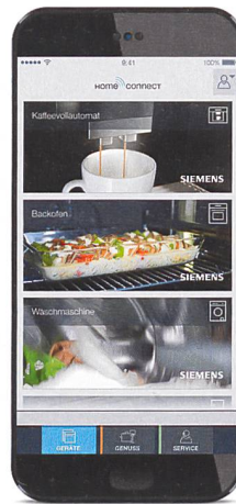
... oder vom Smartphone.