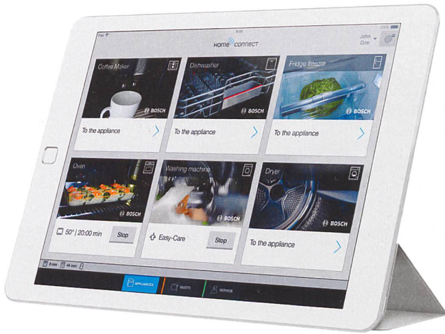
Die verschiedenen Hausgeräte lassen sich vom iPad ansteuern ...