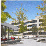
Wohnüberbauung Katzenbach II, Zürich