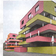
Wohnsiedlung Affoltern, Zürich