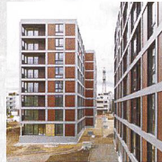
Wohnsiedlung Schaffhauserstrasse, Zürich