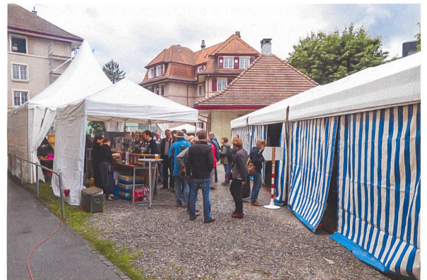
Im Hof der Siedlung Wasenstrasse fand das gemeinsame Jubiläumsfest der Biwog und der Casanostra statt.