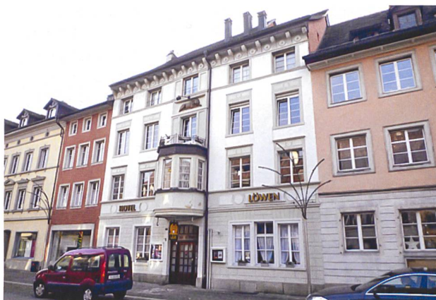
Der «Löwen» Diessenhofen ist neu in genossenschaftlichem Besitz.

Veranstaltungsprogramm und weitere Informationen unter www.leue-event.ch und www.wohnenplus-sh.ch .