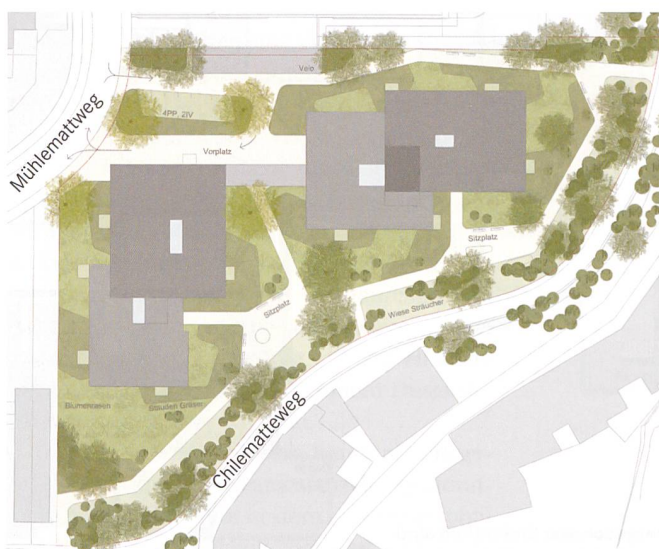
Situation der Neubausiedlung Zopfmatte.