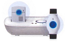
SmartLife Care Flex Das flexible Multitalent mit Zusatz- lautsprecher in der Ladestation

Mit Swisscom SmartLife Care ist Hilfe sofort zur Stelle, wenn Sie sie brauchen.