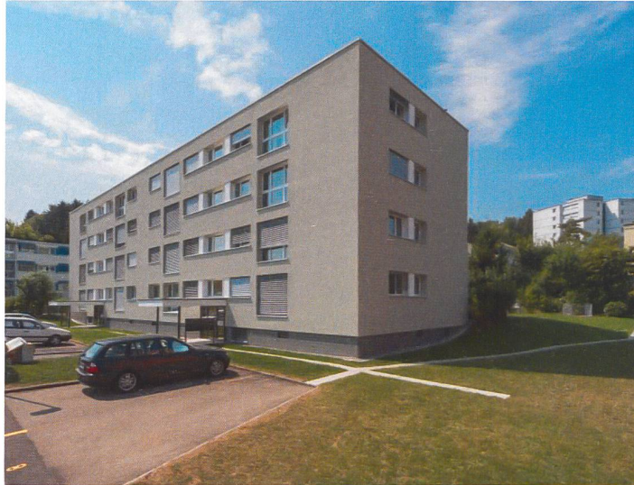
Gesamtsanierung MFH Am Brunnenbächli in Zollikerberg

Liegenschaftsanalysen Generalplanungen Bauleitungen