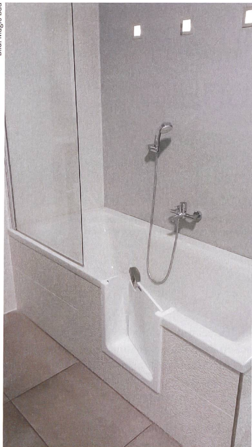
Der Einbau einer Badewannentür ist eine kostengünstige Lösung, um mehr Sicherheit beim Einstieg in die Badewanne zu gewährleisten.