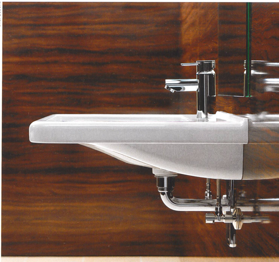
Nicht nur für Menschen im Rollstuhl praktisch: unterfahrbarer Waschtisch.

Eine überzeugende Lösung für alle statt Flickwerk: Dieses Prinzip des «universal design» wird nun auch auf das Badezimmer übertragen. Möglichst alle Generationen sollen es bequem und ohne Einschränkungen benutzen können, vom Krabbelkind über ältere Geschwister und Eltern bis hin zum Grossvater. Ein Vorteil dieses Zugangs ist seine Offenheit für Veränderungen, die unabhängig vom Lebensalter eintreten können. Eine barrierefreie Dusche kann für eine sportliche Mietpartei lediglich «nice to have» sein. Bricht sich aber jemand das Bein, ist der einfache Zugang zur Dusche über Nacht Gold wert.