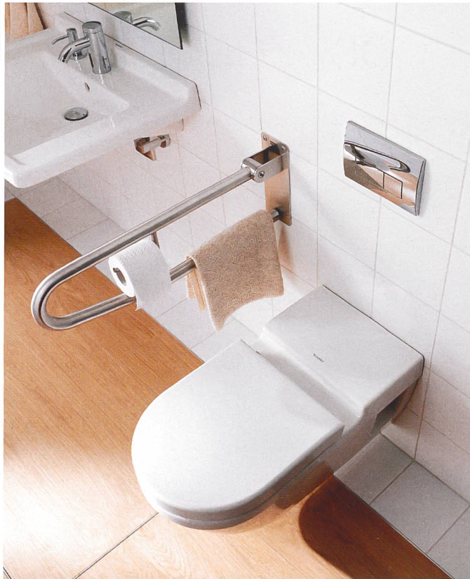
Barrierefreies WC mit Multifunktions-Haltegriff.