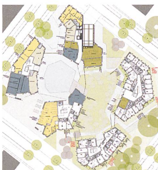
Lageplan von WagnisART.

Im Jahr 2000 gründeten 21 Mitglieder die wagnis eG mit der Vision, ein innerstädtisches Quartier zu entwickeln, das gutes, angenehmes Wohnen in allen Lebensphasen und im Einklang mit den eigenen und den Bedürfnissen anderer Menschen ermöglicht. Bereits Ende 2004 bezogen die ersten Mieterinnen und Mieter die Siedlung wagnis1. Die Genossenschaft etablierte sich schnell und bereichert 15 Jahre nach ihrer Gründung mit vier Überbauungen die städtischen Entwicklungsgebiete Ackermannbogen und München Riem.