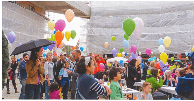
Erste gemeinschaftliche Anlässe fanden bereits statt.

Wir treten in den Hof, der sich in einen Dorfplatz und eine Oase gliedert. Am Dorfplatz liegen weitere öffentliche Nutzungen wie Praxisräume, Büros oder Ateliers. Die grüne Oase wurde gemeinschaftlich bepflanzt und dient den Bewohnenden hauptsächlich zur Erholung. Aktivitäten im neuen Stadtquartier werden bereits jetzt von einem Verein gefördert und koordiniert, der von wagnis mitinitiiert wurde. Die Führung ist zu Ende. Wir stehen staunend im Eingang von Haus Australien, hier haben alle