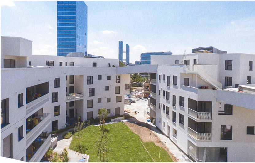
Der Hof ist in einen «Dorfplatz» mit Nutzungen wie Praxisräumen, Büros und Ateliers sowie eine «Oase» (Bild) gegliedert.