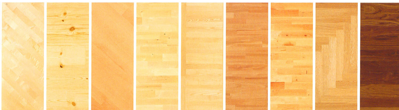
Beliebte Parkettarten in der Schweiz: Ahorn, Kiefer, Buche, Birke, Esche, Kirschbaum, Erle, Eiche, Nussbaum.