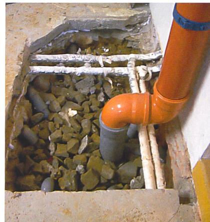
Eine Sanierungsmöglichkeit ist die punktuelle Absaugung von Radon («Radonbrunnen»).