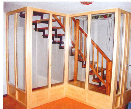
Schutz vor Radon kann eine Abdichtung des Kelleraufganges bieten (Bilder vorher und nachher).