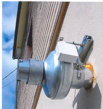
Ein aussenliegender Ventilator erzeugt einen leichten Unterdruck unter der Bodenplatte.