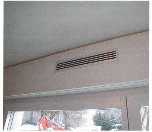
Der Einbau einer Komfortlüftung kann das Radonproblem lösen.