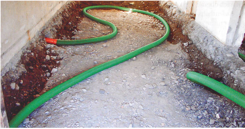
Einbau einer Radondrainage im Rahmen einer Erneuerung des Fussbodenaufbaus.