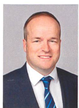
Thomas Elmiger Rechtsdienst

Bauvorhaben beeinträchtigen immer wieder die Interessen von Nachbarn. Wer käme da auf die Idee, dass das Ergreifen eines Rechtsmittels gegen eine Baubewilligung möglicherweise missbräuchlich sein könnte?