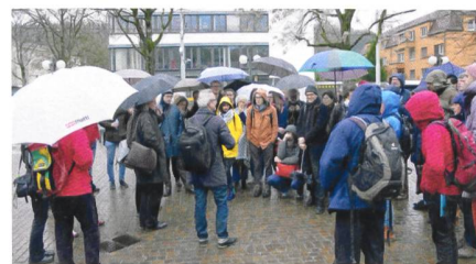
Exkursion durch die Zürcher Genossenschaftswelt (hier am Schwamendingerplatz): Westschweizer und Zürcher Genossenschaften lernten sich an einer zweitägigen Veranstaltung näher kennen.

Am Abend folgte eine gutbesuchte öffentliche Veranstaltung im Architekturforum Zürich, wo Westschweizer Genossenschaften wie Equilibre, Codha, En Face und Le Bled ihre Projekte vorstellten. Dabei zeigte sich das Publikum be-