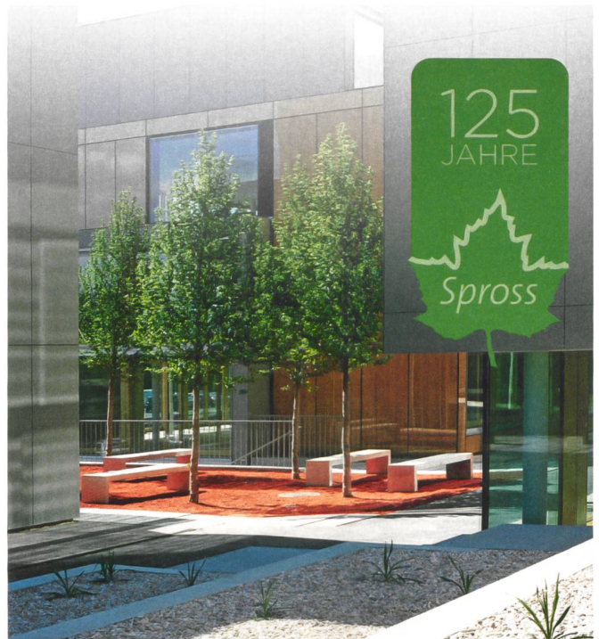
Spross Ga-La-Bau Projekt Zürich Seewürfel

wertbaren Bauabfälle steht seit 2001 das eigene, an Zürichs Hohlstrasse gelegene Abfallannahme- und Sortierwerk Debag mit eigenem Bahnanschluss zur Verfügung.