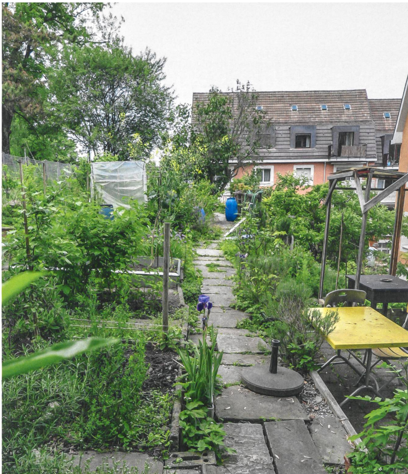
Die Nutzgärten an der Böschung über der Siedlung blieben erhalten.

Ein Kritikpunkt, der auch von einem Bewohner vor Ort eingebracht wird. Sonst aber gefalle ihm und seiner Familie die Neugestaltung. «Wir haben es nicht so mit Schickimicki. Wir fühlen uns wohler, wenn es ein bisschen natürlich ist.» Hier sind jedoch nicht ganz alle der gleichen Meinung. Als «schrecklich» bezeichnet eine ältere Bewohnerin das hoch gewachsene Gras auf Nachfrage. Und erzählt wenige Sätze später: «Gestern habe ich mir aber erlaubt, vor dem Haus ein paar «Margritli» für einen Blumenstrauss zu pflücken.» Etwas, was vor wenigen Jahren noch nicht möglich gewesen wäre. ■