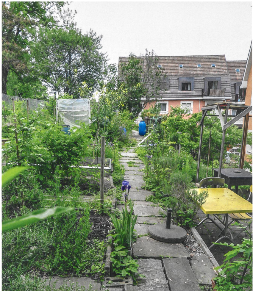
Die Nutzgärten an der Böschung über der Siedlung blieben erhalten.

Ein Kritikpunkt, der auch von einem Bewohner vor Ort eingebracht wird. Sonst aber gefalle ihm und seiner Familie die Neugestaltung. «Wir haben es nicht so mit Schickimicki. Wir fühlen uns wohler, wenn es ein bisschen natürlich ist.» Hier sind jedoch nicht ganz alle der gleichen Meinung. Als «schrecklich» bezeichnet eine ältere Bewohnerin das hoch gewachsene Gras auf Nachfrage. Und erzählt wenige Sätze später: «Gestern habe ich mir aber erlaubt, vor dem Haus ein paar «Margritli» für einen Blumenstrauss zu pflücken.» Etwas, was vor wenigen Jahren noch nicht möglich gewesen wäre. ■