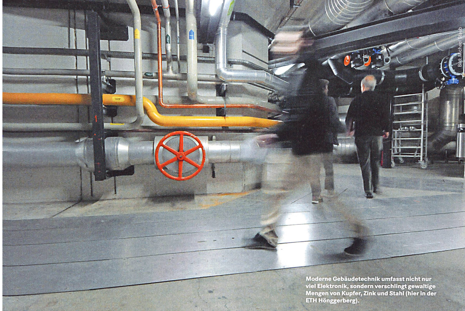
Moderne Gebäudetechnik umfasst nicht nur viel Elektronik, sondern verschlingt gewaltige Mengen von Kupfer, Zink und Stahl (hier in der ETH Höggerberg).

Neuste Haustechnik und alte Bauten vertragen sich nicht immer