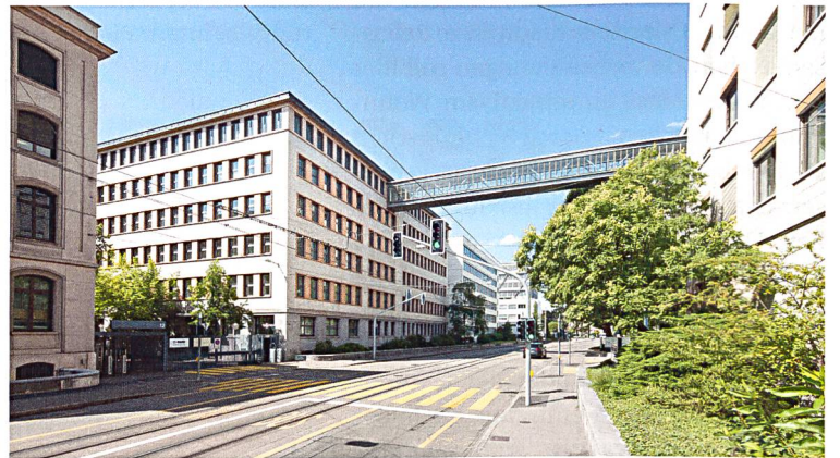
Verwaltungsgebäude, Produktionshallen und grosse Logistikflächen prägen das Klybeckquartier. Sie sollen schrittweise neu genutzt werden.

Gewerbe und Büros, so ein erstes Fazit. Wie weit sich das exponierte Gebiet zwischen Autobahn und Bahnareal tatsächlich zum Wohnen eignet, ist allerdings unklar. Die SBB wollen bis Ende Jahr über die Ergebnisse von Studienauftrag und Beteiligungsprozess orientieren.