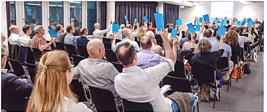
GV des Regionalverbands Zürich: positiv gestimmte Mitglieder.