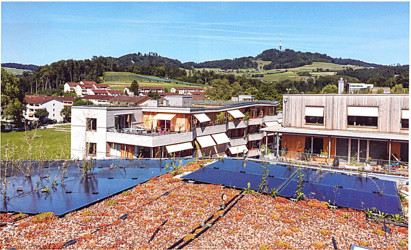
Die Wohnbaugenossenschaft Oberfeld in Ostermundigen (BE) gehört zu den genossenschaftlichen Pionieren, die PVT-Hybridkollektoren nutzen; diese produzieren gleichzeitig Strom und Wärme. In ihrer 2014 fertiggestellten Siedlung ist eine 1360 Quadratmeter grosse Anlage installiert.