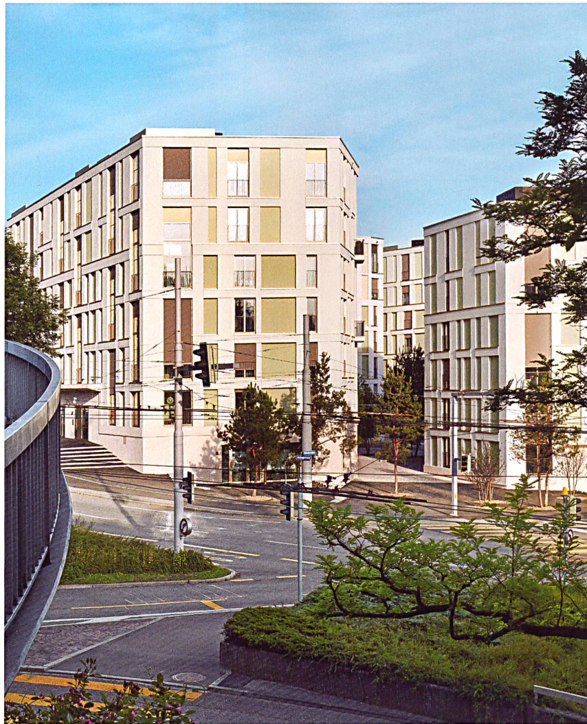
Übergrosse Fenster, Nischen und Vorsprünge prägen die Strassenfassaden, die dank der klaren Gliederung trotzdem als Gesamtsystem erscheinen.

In diesem Gesamtsystem erscheinen die Grossfenster nun wie ein Gestaltungselement unter mehreren. Da die für die Nischen verwendeten Fassadenelemente aus mineralisch verputzten Holzbauteilen bestehen, lassen sich trotz reduzierter Mauerdicke Minergie-P-taugliche Dämmwerte erzielen. Strukturiert wird das bunte Nebeneinander von Fenstern, Nischen und Vorsprüngen durch eine klare Gliederung der Fassade in Sockelgeschoss, Mittelteil und oberen Bereich. Dank den vielfältig und abwechslungsreich gestalteten Strassenfassaden wirkt die neue Siedlung auch nach aussen einladend, obwohl die Wohnungen klar zum Innenhof hin orientiert sind. Zum Eindruck einer gegen aussen offenen Siedlung tragen auch diverse gewerbliche Nutzungen in den Sockelgeschossen bei; so haben sich ein Elektrogeschäft, eine Zahnarztpraxis, eine Fahrschule und eine Reparaturwerkstätte für Alltagsgegenstände eingemietet.