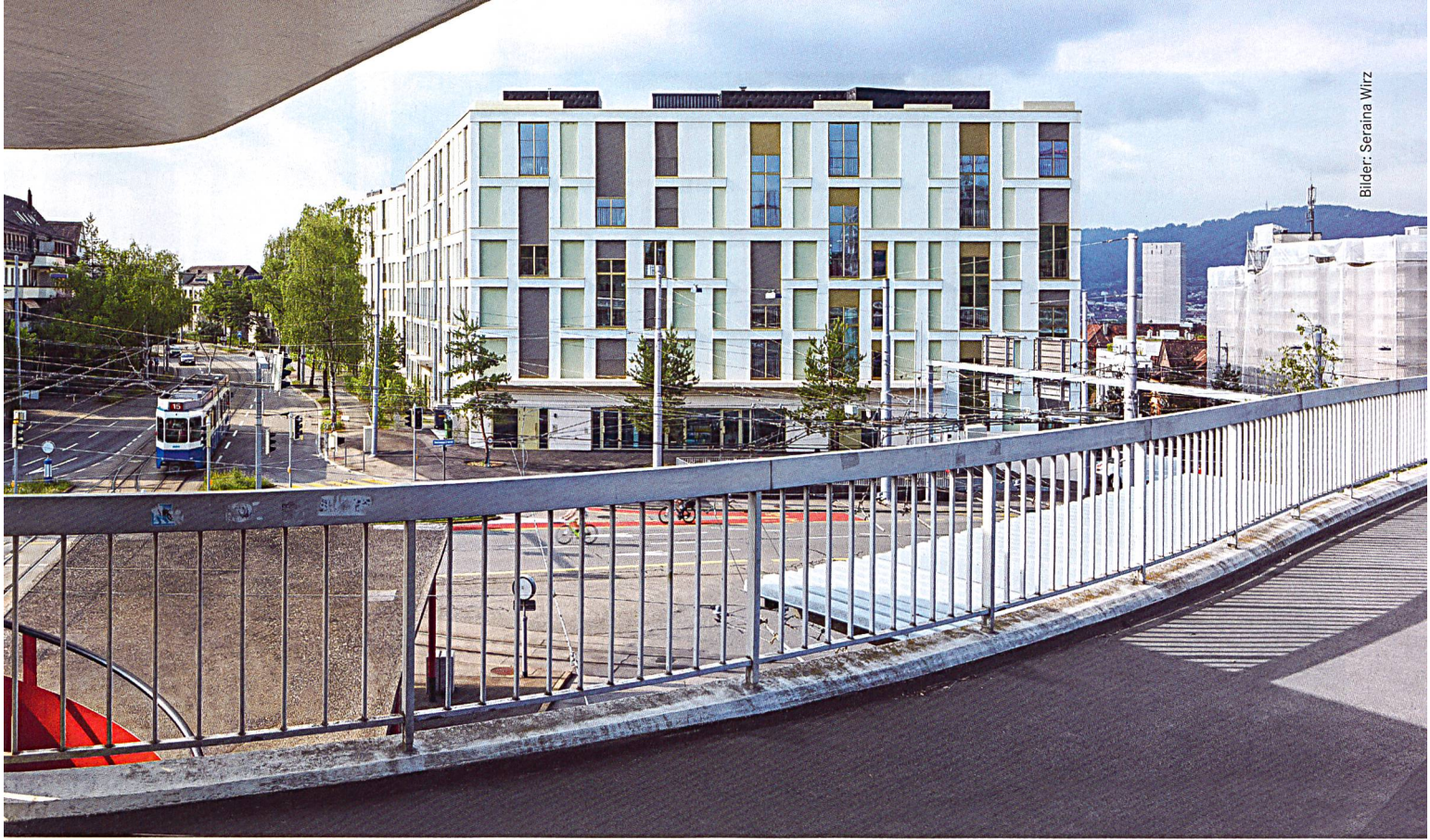
Der Kopfbau der neuen Siedlung richtet sich gegen den exponierten Bucheggplatz und schafft dort einen markanten Abschluss.

Baugenossenschaft Waidberg erstellt Ersatzneubausiedlung Buchegg