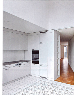
Dank der ungewöhnlichen Grundrisse verfügt jede Wohnung über Stadtblick. Der zwei Stockwerke hohe Essbereich vermittelt ein Loft-artiges Wohngefühl.

Damit sich die Baukörper trotz ihrer grossen Volumina harmonisch ins Quartier einfügen, sind die Fassaden der oberen beiden Gebäude auf halber Länge in einem deutlichen Winkel geknickt. Schliedert man strassenseitig an den Fassaden entlang, ist somit immer nur einer der beiden Gebäudeschenkel sichtbar. Dank dieser optischen Halbierung füllt die Übergrösse der neuen Bauten im Vergleich zu den um ein Vielfaches kleineren Zeilenhäusern der Nachbarschaft kaum auf. Auch hofseitig wurden die Fassaden mit mehreren, wenn auch kleineren Knicks gefaltet. «Hier ging es uns darum, die Fassadenabwicklung zu vergrössern und auf diese Weise zusätzliche Flächen für Fenster